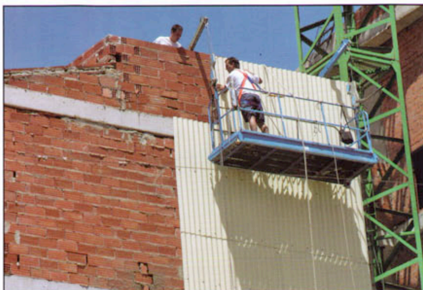
Construcción de un tabique pluvial.